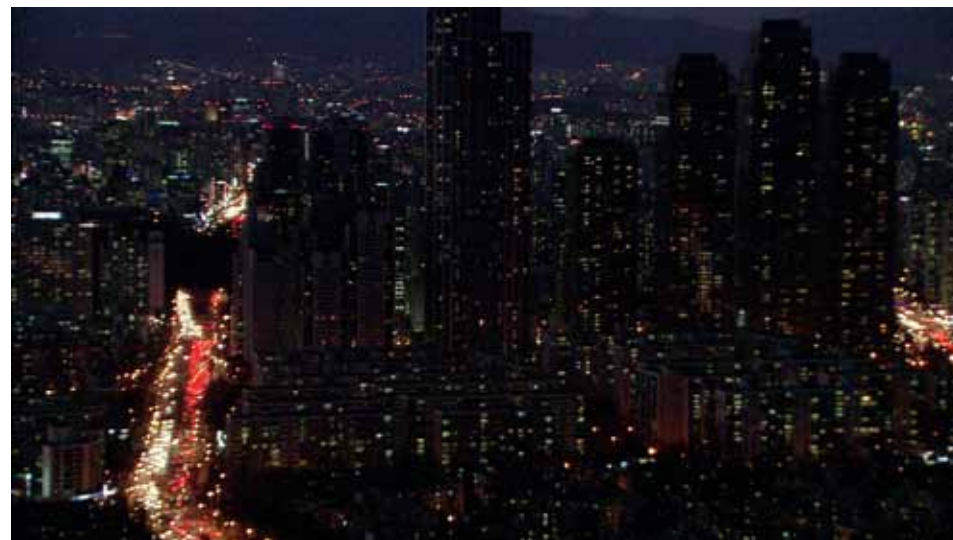
PHONE TAPPING production du Fresnoy, Studio National des Arts Contemporains