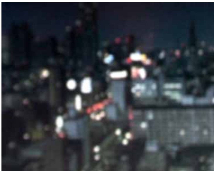
KARAOKE Vidéo couleur, son stéréo, 2009