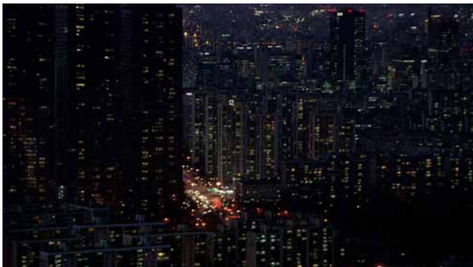
PHONE TAPPING Video HD 3D compositing, 10'20, couleur, son stéréo, 2009